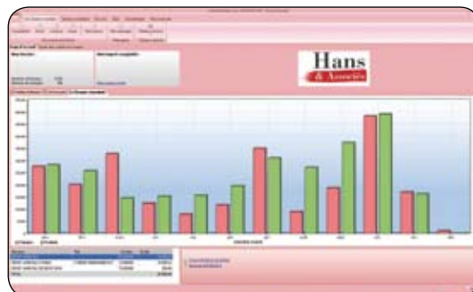
Page d'accueil du module de consultation

Informez-vous sur l'actualité juridique, sociale, comptable et fiscale.