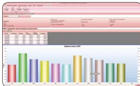
Vue synoptique des paies des employés

* Tarif à partir de 15 euros, variable selon la taille de l'entreprise.